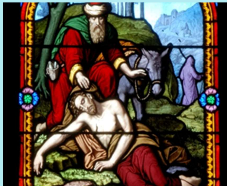
Den barmhärtige samariten